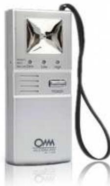
Fig. 3 Etilómetro Aloscan Modelo AL 1100

Con la aprobación e implantación de la Ley 109/2011 “Código de Seguridad Vial” se estipula en los incisos 1) y 2) del artículo 93 que se prohíbe conducir vehículos o permitir que otro conduzca bajo los efectos del alcohol, para los vehículos destinados a carga o transporte colectivo de pasajeros, para los