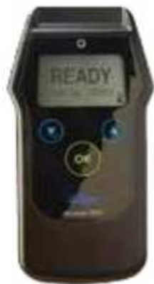
Fig. 4 Alcotest 5510

Por todo esto la Dirección Nacional de Tránsito del Ministerio del Interior adquirió etilómetros del fabricante Dräger Alcotest Modelos 5510 y 6820 evidenciales y que cumplen con las características establecidas por la OIML para este tipo de instrumentos los cuales, deben determinar automáticamente la concentración de alcohol en sangre a través de la medición de su concentración en masa en el aire espirado.