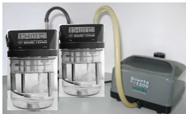
Fig.7 Simuladores de soplo en serie

Por las desventajas ocasionadas por las pérdidas por evaporación de etanol en la fase líquida se adquirieron dos simuladores, los que son conectados en serie para evitar el rápido agotamiento de la solución, que limita el número de mediciones a realizar.