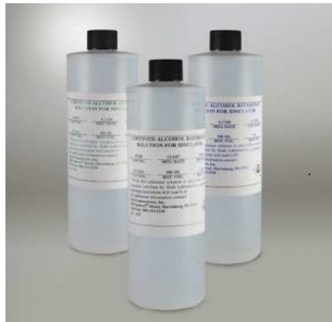
Fig.8 Soluciones de Referencia de Etanol en agua a diferentes concentraciones

En la Fig. 8 y en la Tabla 2 se muestran las Soluciones de Referencia de Etanol en agua a diferentes concentraciones que se utilizan para la verificación de los etilómetros en el país [11].