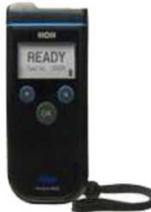
Fig.5 Alcotest 6820