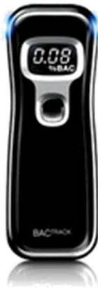
Fig.2 Etilómetro BacTrack Modelo B70